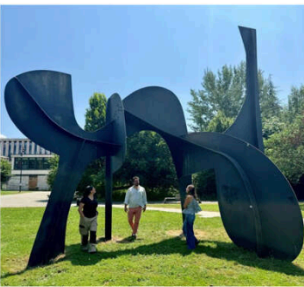
L'œuvre de Calder, La Coranne, située sur le campus de l'UGA.

Saint-Martin-d'Hères (Isère) avait les droits, elle pouvait en faire son logo. Tellement La Coranne ... c'est son nom... est associée au campus. Les innombrables courbes servent autant à s'orienter du soleil quand on se pose dans l'herbe, qu'à celles des affiches pour annoncer les prochains événements. Cette œuvre du sculpteur et peintre américain Alexander Calder (1898-1976), située sur le parvis de la Bibliothèque universitaire Droit et Lettres à Saint-Martin-d'Hères, a pu être sauvée de la démolition depuis 1974, que ce soit par les étudiants, par les enseignants ou même par ses différents transporteurs pour être prêtée à des musées. Certains éléments, comme les fondations, ont par exemple été remplacés sans que l'on tienne compte des choix de Calder. Les fondations carrées d'origine ont ainsi parfois laissé place à des ronds. Partiellement réparé car ses poids par Calder sont sages d'un