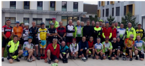
Au départ d'Échirolles.

80 cyclotouristes, dont une quarantaine d'Échirollois, ont traversé la France à vélo jusqu'en Corrèze. Pour les bénévoles, cela représentait un parcours de 520 kilomètres et 6 400 mètres, à travers la Drôme, l'Ardèche, la Haute-Loire, le Cantal et la Corrèze.